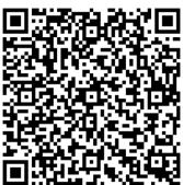
Encuesta de Salud/Bienestar