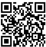
Encuesta de Necesidades de la Comunidad